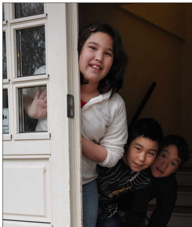
Børnene fra Grønland var friske, selv om det ikke blev til mange timers søvn den første nat i Troldehuset.

– Det bliver nogle trætte børn, der går i seng i aften. Der sker meget nyt for dem, tidsforskellen betyder noget, og så skal de naturligvis ud og prøve kræfter med at klatre i træer og hygge sig i området herude.